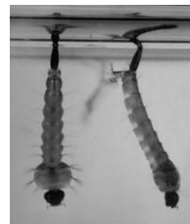
Pitit moustik la

Si w gen problem o kesyon sou zafè moustik, relé Indian River Mosquito Control District nan numero sa-a 772 562-2393 osynon vizité nou sou sit sa-a: