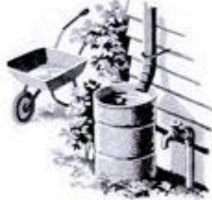
Bourèt and droum